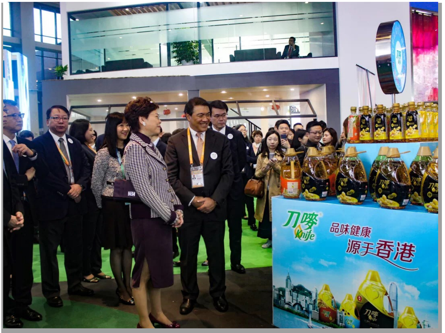
本次进博会中，刀唛专门挑选了四款主打食用油产品参展，分别是刀唛金装浓香花生油、刀唛纯正花生油、刀唛纯正玉米油、刀唛纯正芥花籽油。